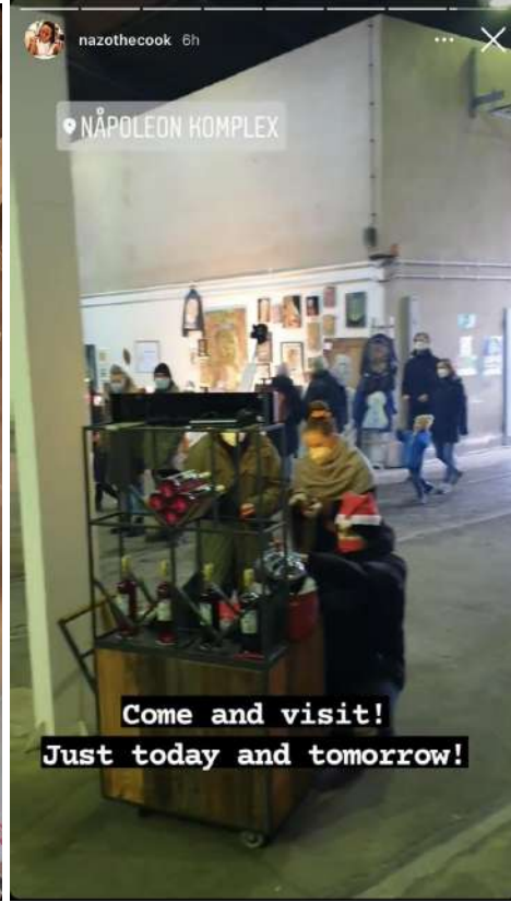
Food_in_berlin, 5.8 K followers